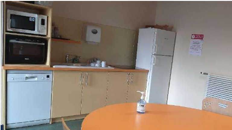
Réfectoire de l'A2B au Pôle Environnement

1 ère solution : Réserver une salle de restauration en interne, avec les divers équipements nécessaires.